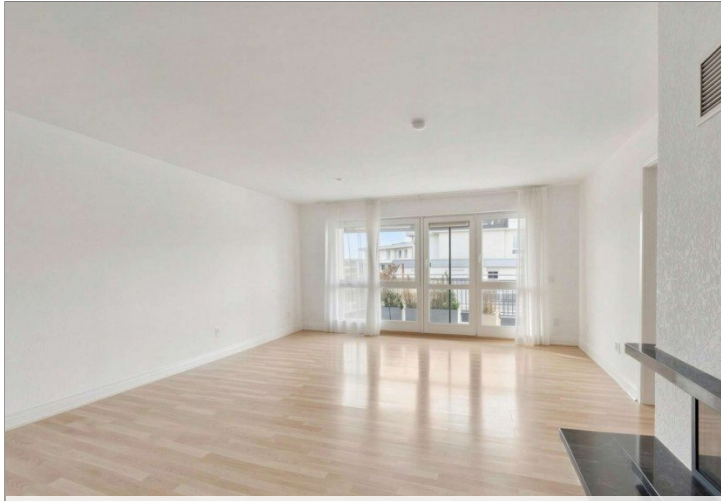
Homestaging Wohnzimmer Penthouse Wiesbaden (11) - (KI generiert)