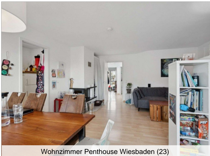
Wohnzimmer Penthouse Wiesbaden (23)