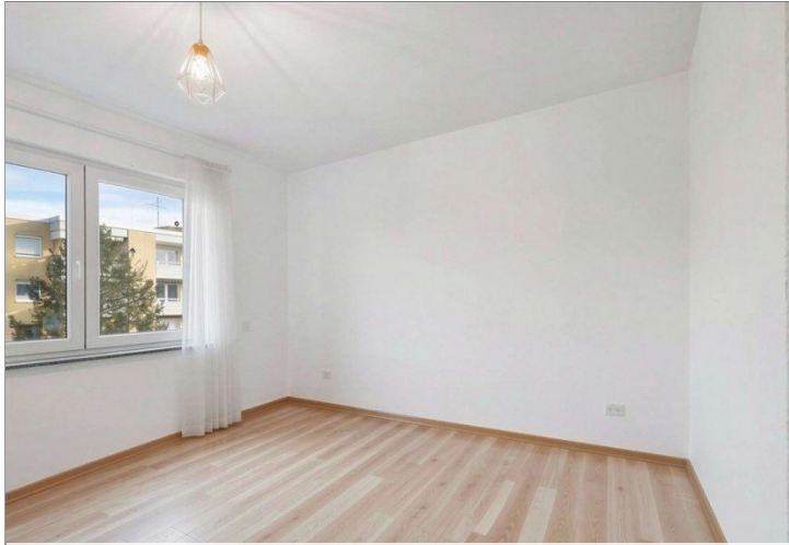
Homestaging Schlafzimmer Penthouse Wiesbaden (6) - (KI generiert)