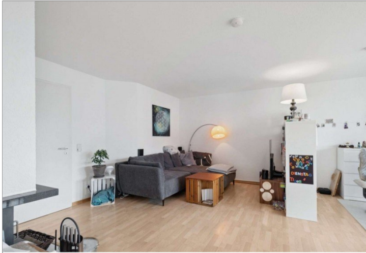
Wohnzimmer Penthouse Wiesbaden (19)