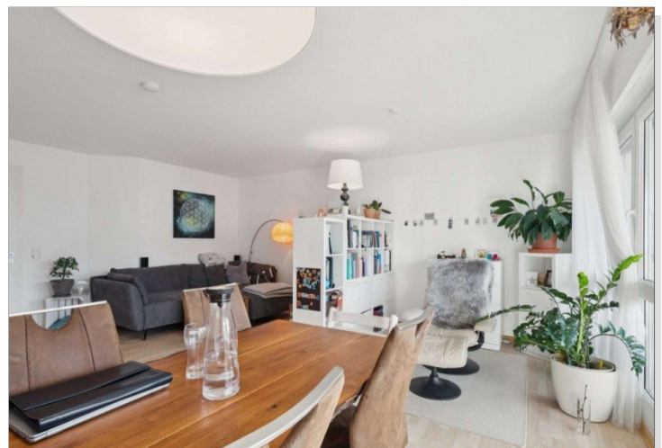
Wohnzimmer Penthouse Wiesbaden (15)