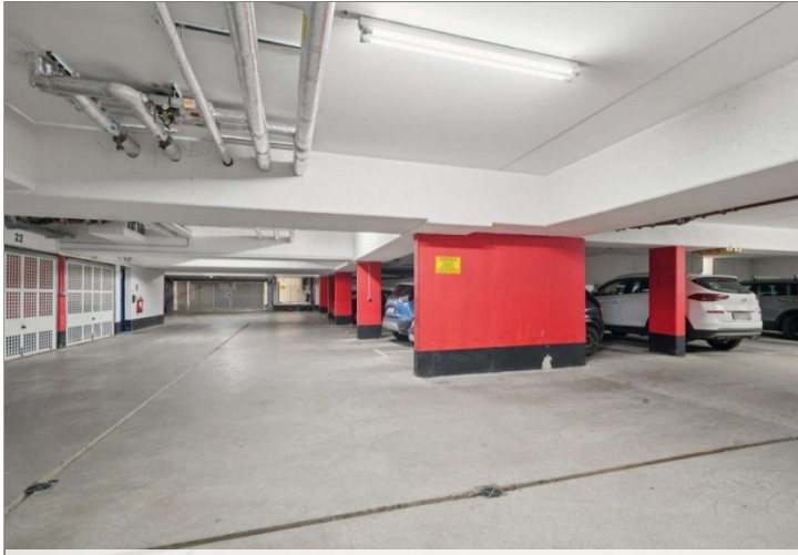
Tiefgarage Penthouse Wiesbaden (25)