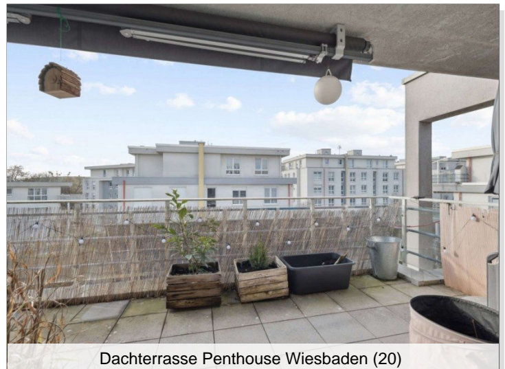
Dachterrasse Penthouse Wiesbaden (20)