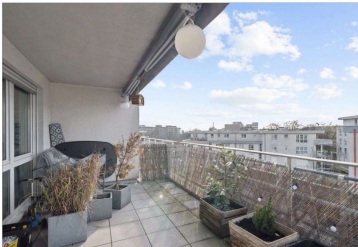
Sonnterrasse Penthouse Wiesbaden (21)