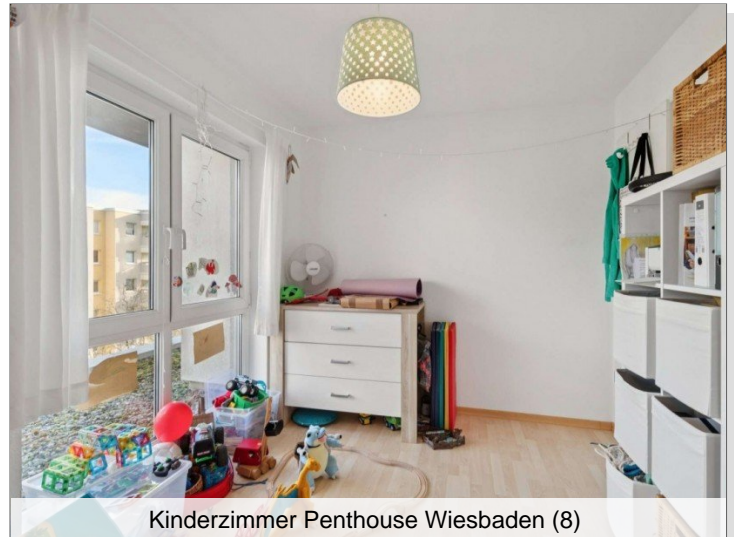
Kinderzimmer Penthouse Wiesbaden (8)