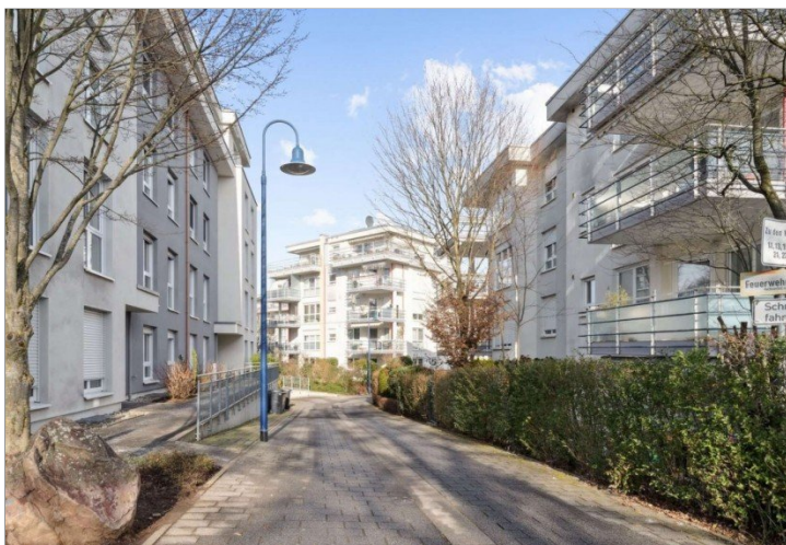
Zugang Penthouse Wiesbaden (5)