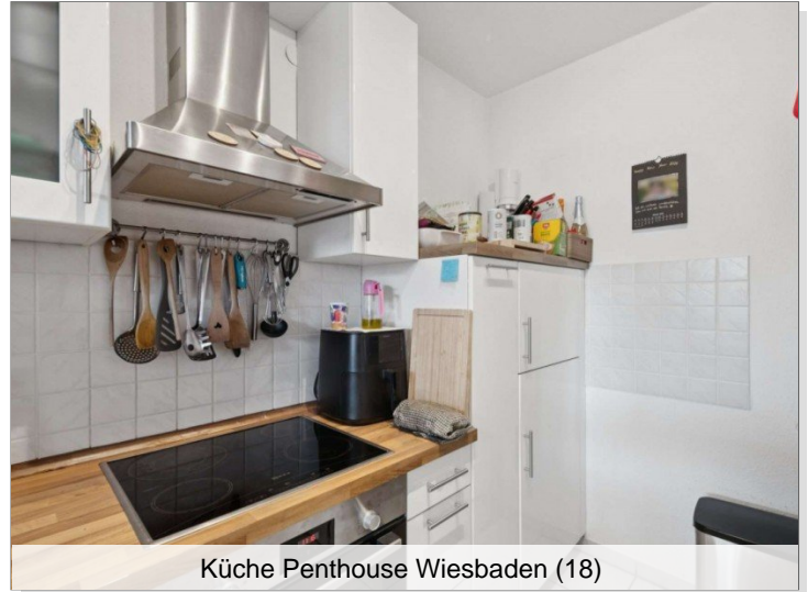
Küche Penthouse Wiesbaden (18)