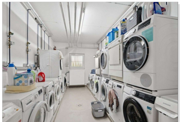
Hauswirtschaftsraum Penthouse Wiesbaden (24)