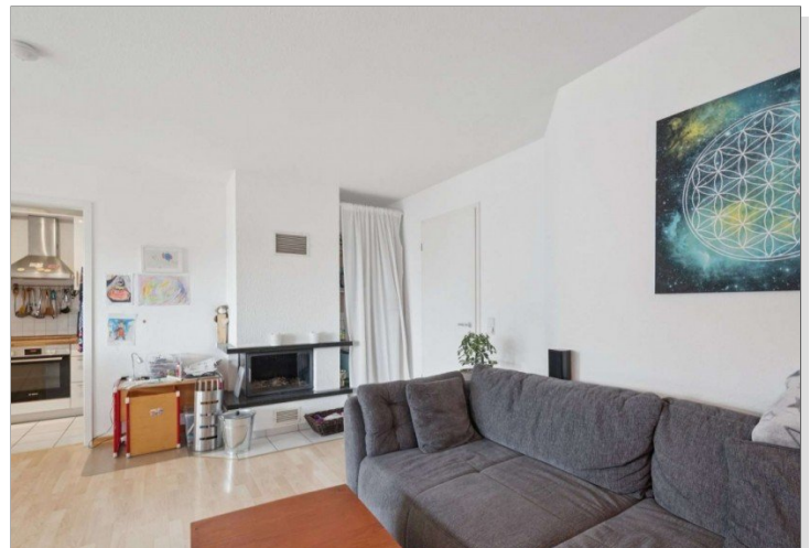
Wohnzimmer Penthouse Wiesbaden (13)