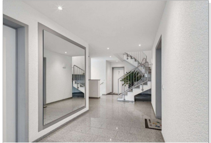
Hausflur Penthouse Wiesbaden (2)