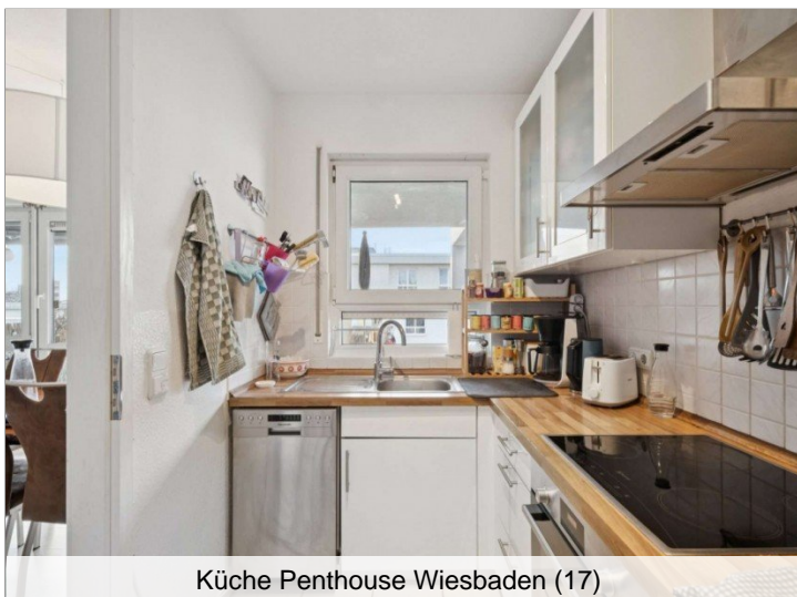
Küche Penthouse Wiesbaden (17)