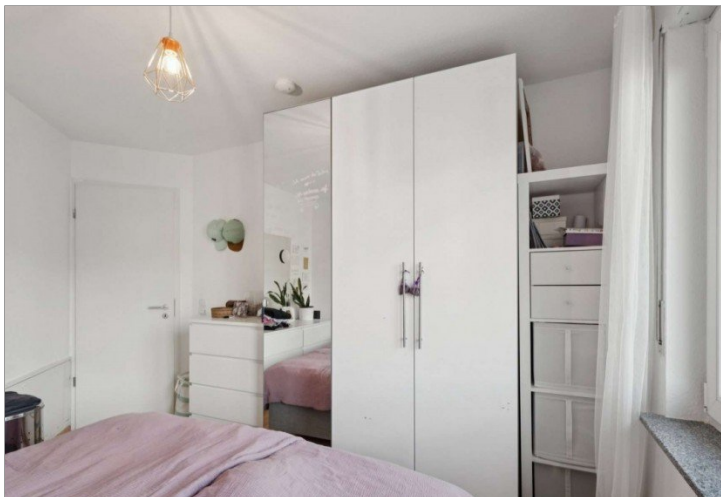
Schlafzimmer Penthouse Wiesbaden (7)