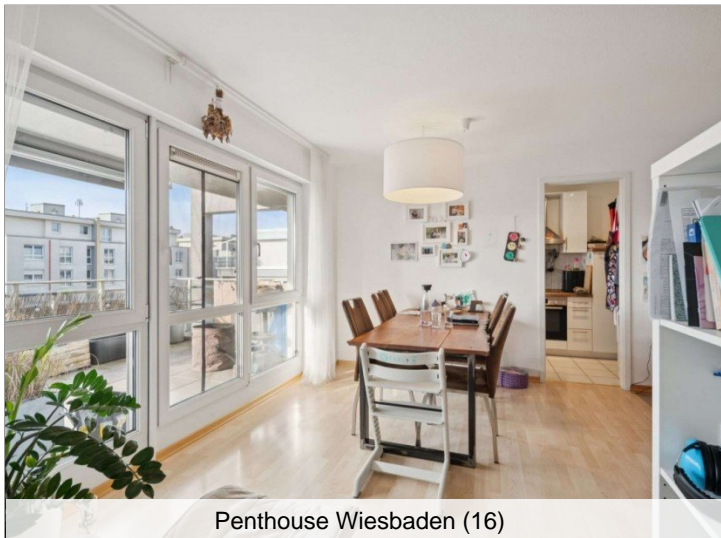
Penthouse Wiesbaden (16)