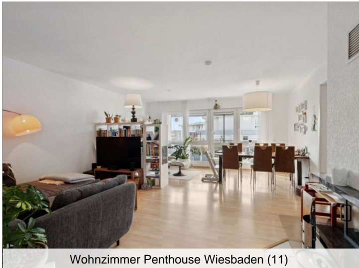
Wohnzimmer Penthouse Wiesbaden (11)