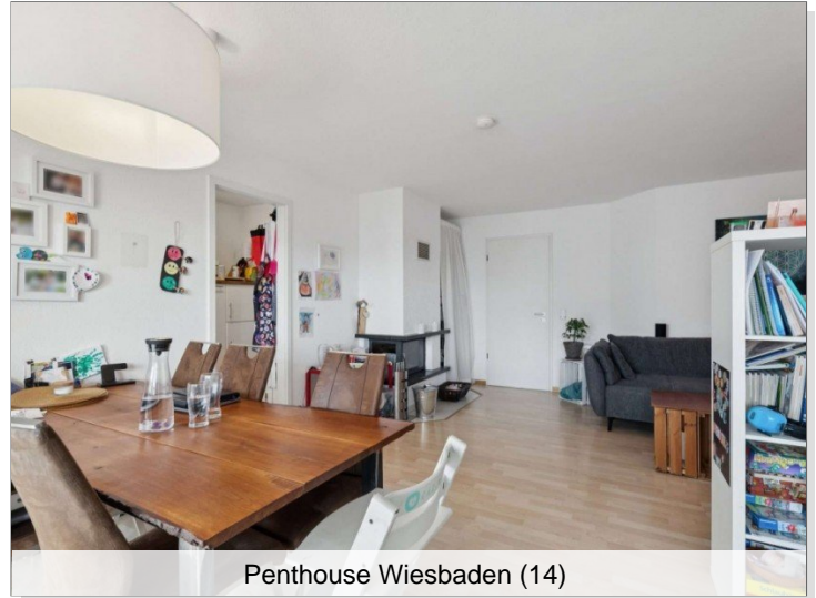
Penthouse Wiesbaden (14)