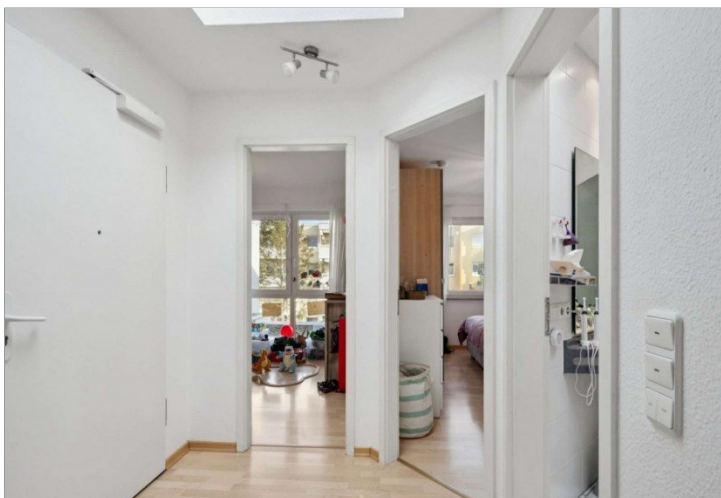
Flur Penthouse Wiesbaden (9)