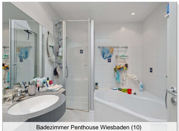
Badezimmer Penthouse Wiesbaden (10)