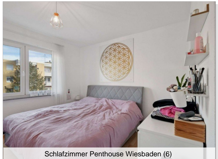
Schlafzimmer Penthouse Wiesbaden (6)