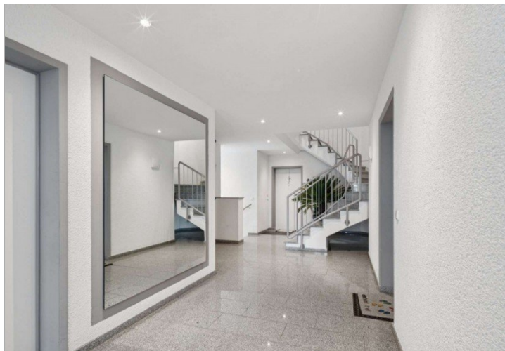
Hausflur Penthouse Wiesbaden (2)