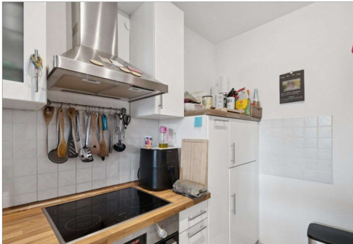
Penthouse Wiesbaden (18)