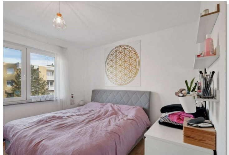
Penthouse Wiesbaden (6)