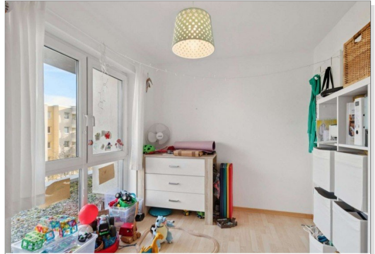
Penthouse Wiesbaden (8)