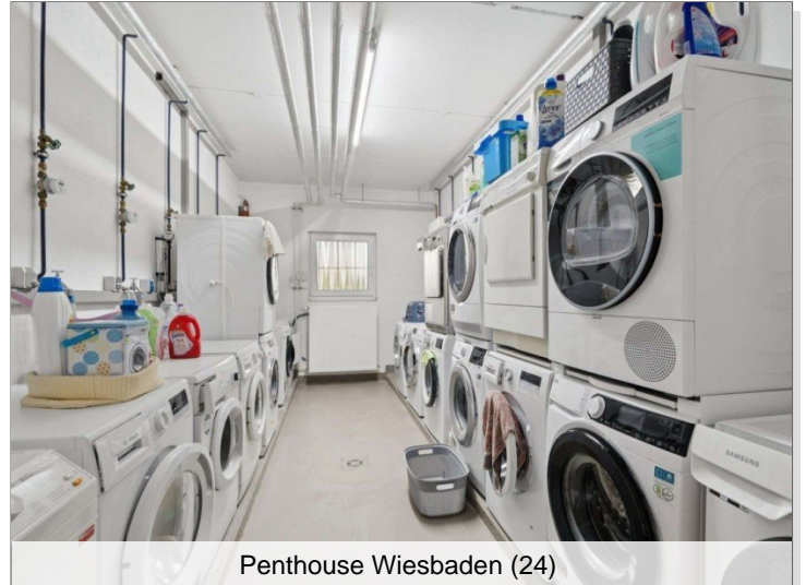
Penthouse Wiesbaden (24)