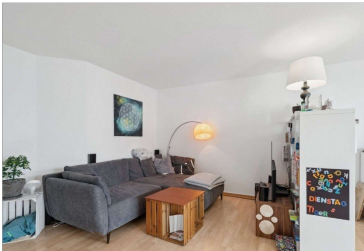
Penthouse Wiesbaden (12)