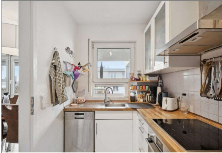
Penthouse Wiesbaden (17)