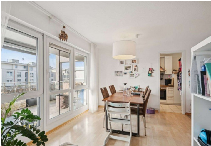
Penthouse Wiesbaden (16)