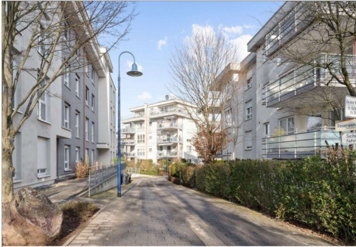
Penthouse Wiesbaden (5)