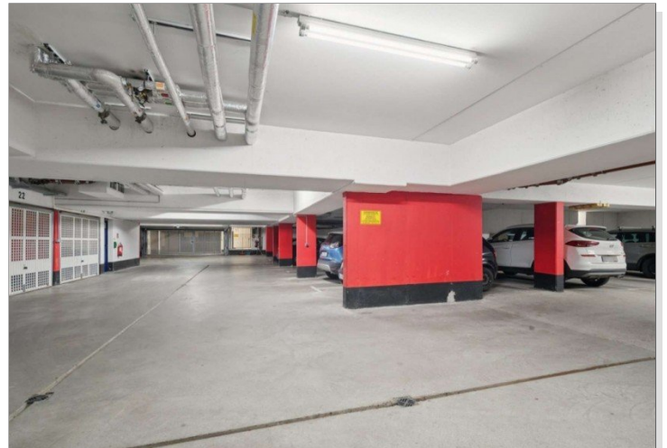
Penthouse Wiesbaden (25)