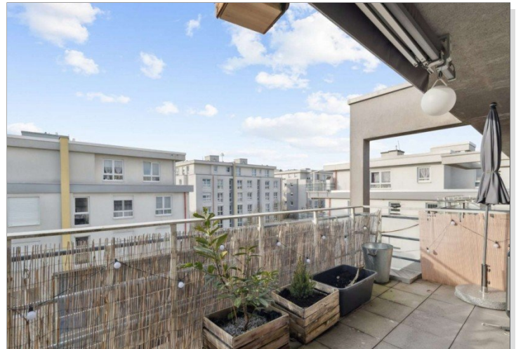
Penthouse Wiesbaden (22)