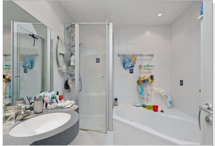
Penthouse Wiesbaden (10)