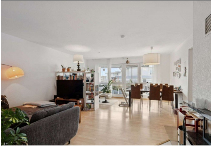
Penthouse Wiesbaden (11)