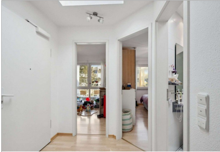
Penthouse Wiesbaden (9)