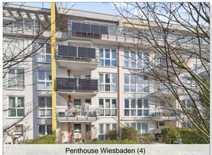
Penthouse Wiesbaden (4)