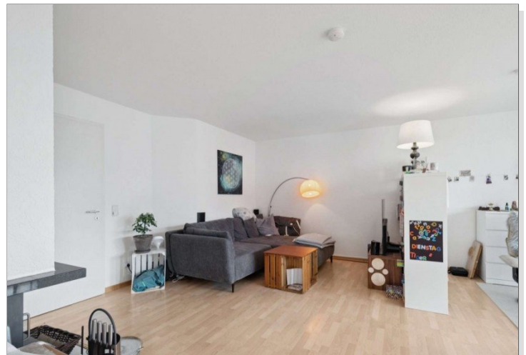
Penthouse Wiesbaden (19)