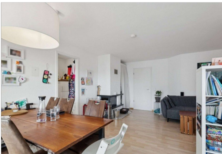
Penthouse Wiesbaden (14)