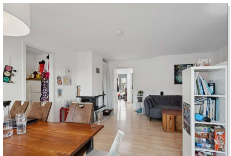
Penthouse Wiesbaden (23)