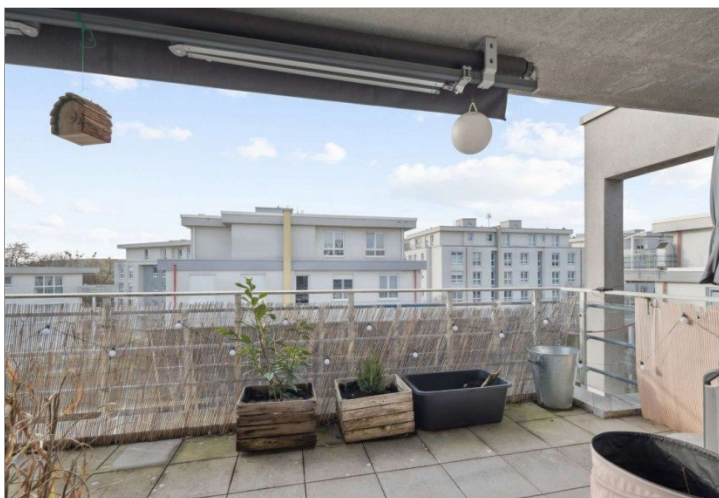
Penthouse Wiesbaden (20)