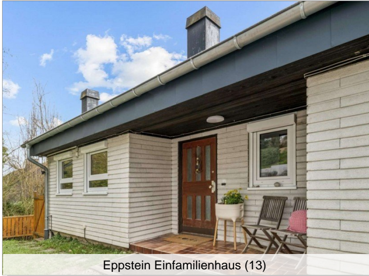
Eppstein Einfamilienhaus (13)