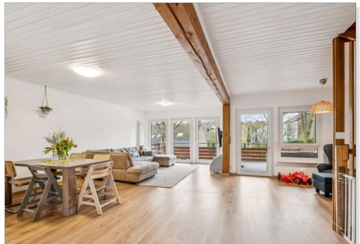
Eppstein Einfamilienhaus (20)