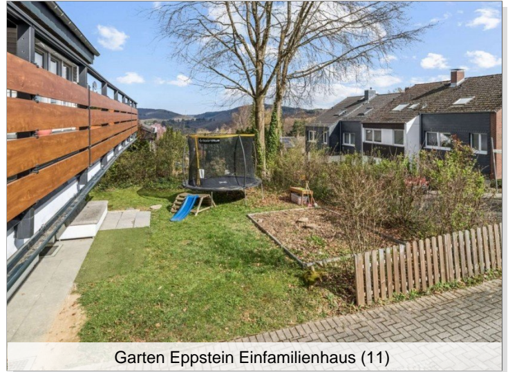
Garten Eppstein Einfamilienhaus (11)