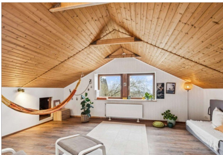
Dachgeschoß Eppstein Einfamilienhaus (17)