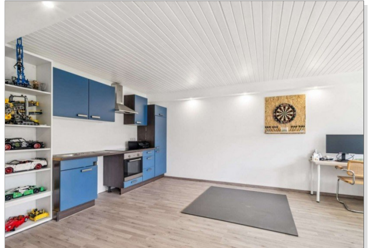
Küche Einliegerwohnung Eppstein Einfamilienhaus (6)