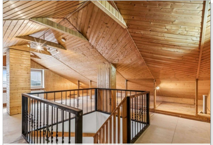
Dachgeschoß Eppstein Einfamilienhaus (14)