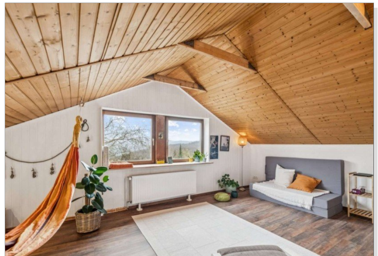
Dachgeschoß Eppstein Einfamilienhaus (16)