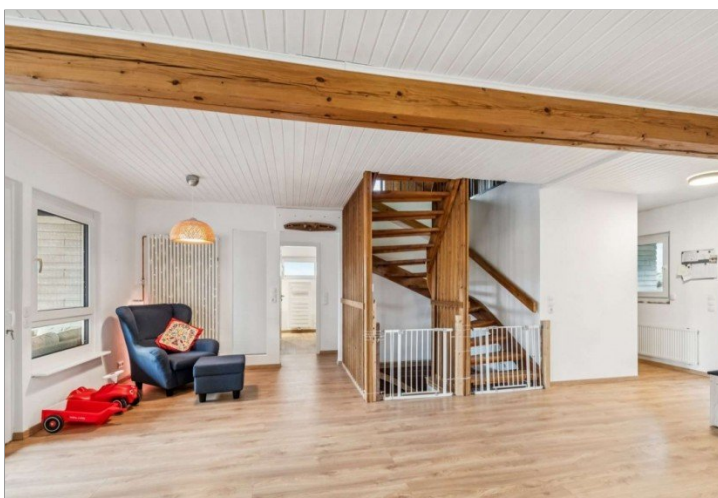
Eppstein Einfamilienhaus (23)