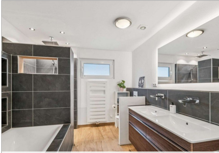
Badezimmer Eppstein Einfamilienhaus (25)