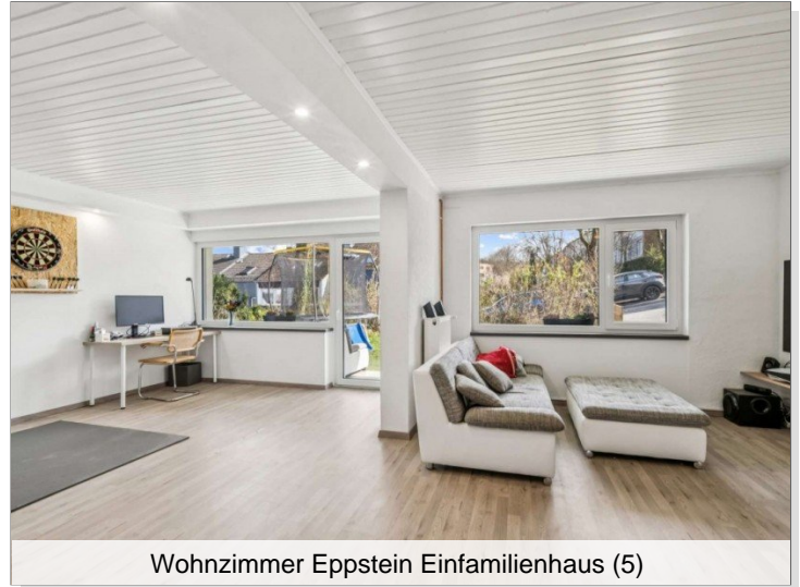
Wohnzimmer Eppstein Einfamilienhaus (5)