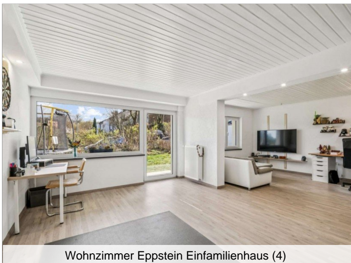
Wohnzimmer Eppstein Einfamilienhaus (4)