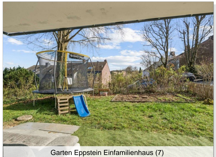
Garten Eppstein Einfamilienhaus (7)