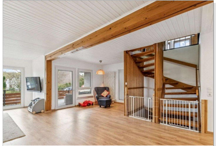
Eppstein Einfamilienhaus (22)