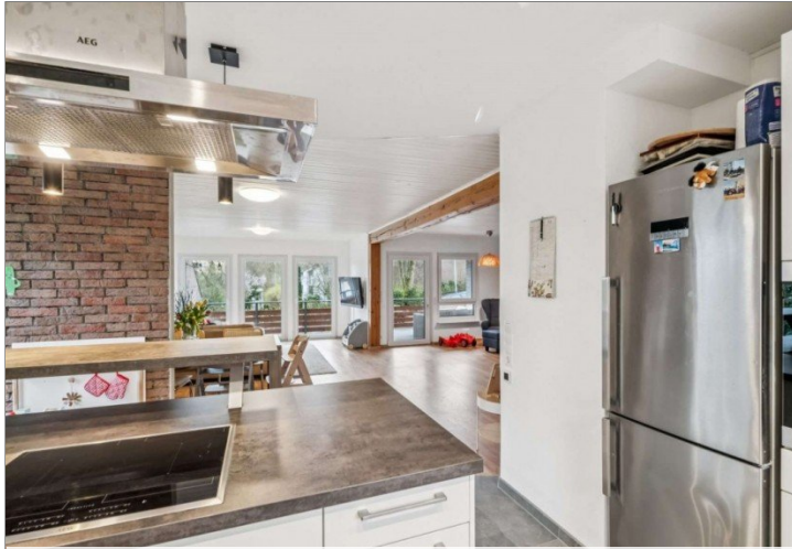
Küche Eppstein Einfamilienhaus (19)