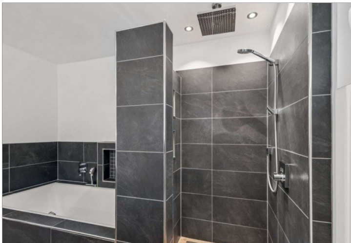
Badezimmer Eppstein Einfamilienhaus (1)