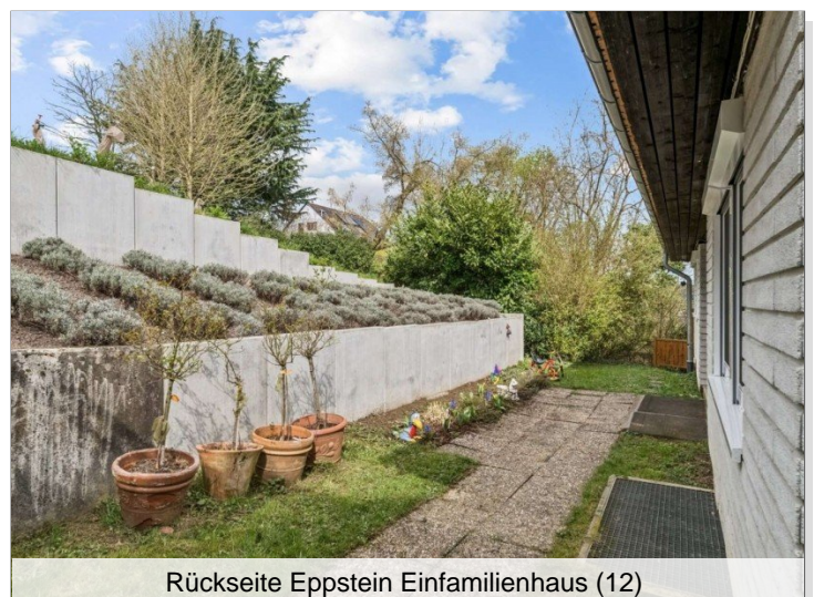
Rückseite Eppstein Einfamilienhaus (12)