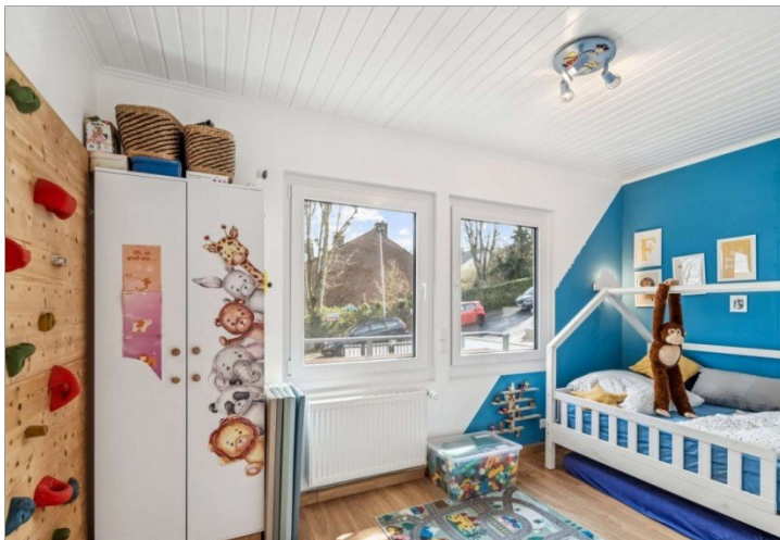
Kinderzimmer Eppstein Einfamilienhaus (3)