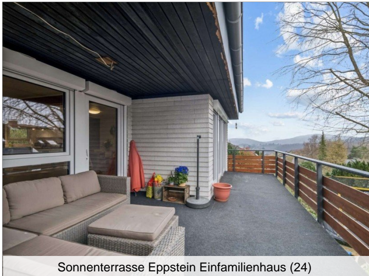
Sonnenterrasse Eppstein Einfamilienhaus (24)