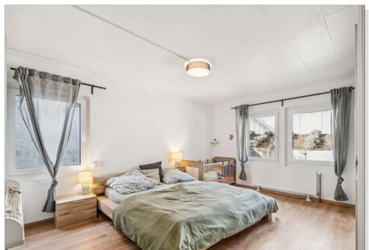
Schlafzimmer Eppstein Einfamilienhaus (2)