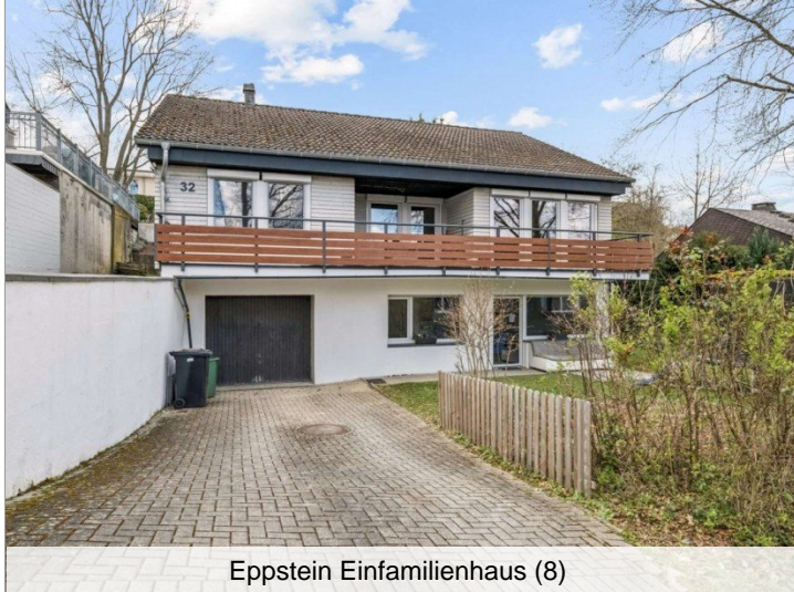
Eppstein Einfamilienhaus (8)