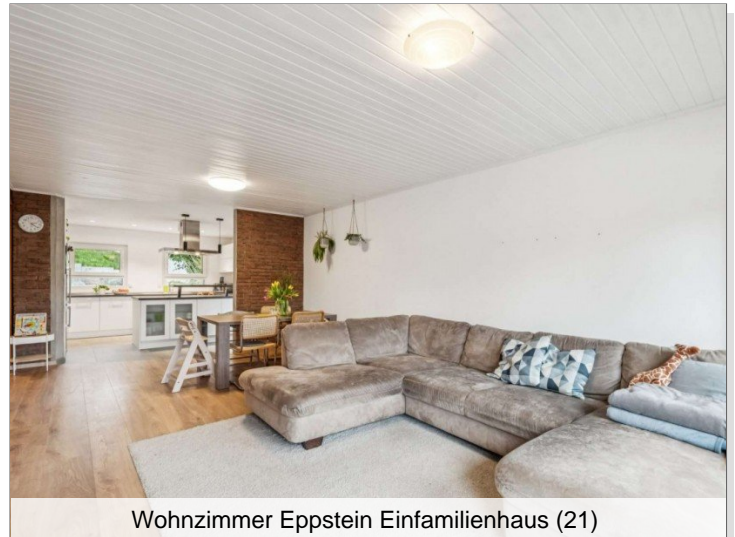
Wohnzimmer Eppstein Einfamilienhaus (21)