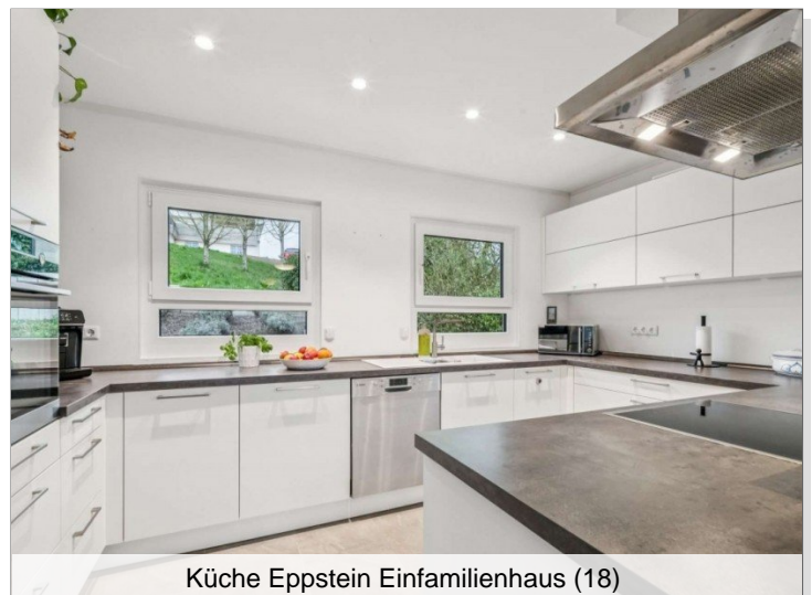
Küche Eppstein Einfamilienhaus (18)