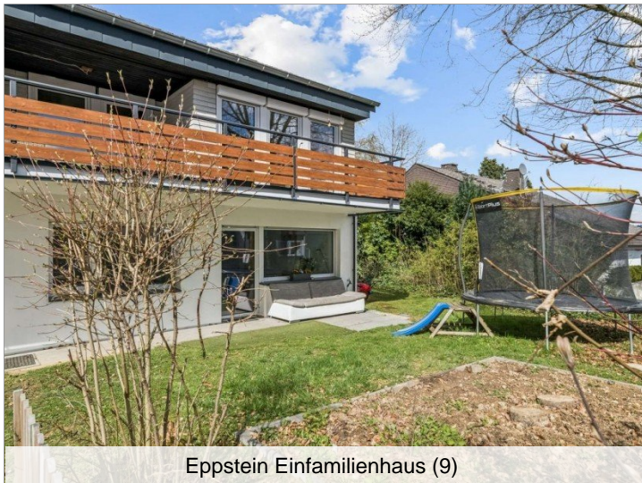
Eppstein Einfamilienhaus (9)