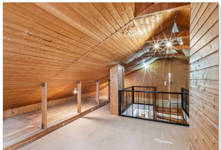
Dachgeschoß Eppstein Einfamilienhaus (15)