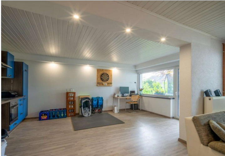
Einliegerwohnung Eppstein Bremthal