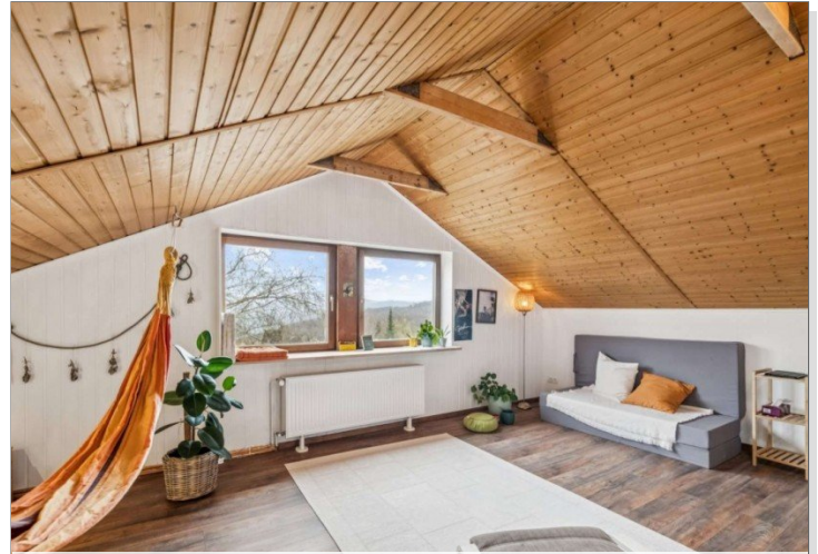
Eppstein Einfamilienhaus (16)