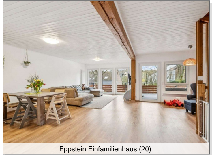
Eppstein Einfamilienhaus (20)