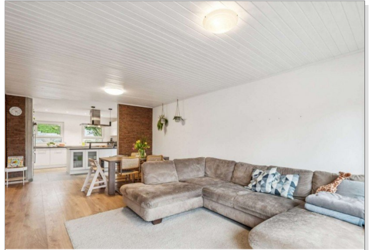
Eppstein Einfamilienhaus (21)