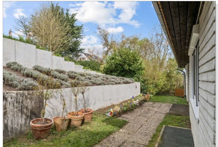
Eppstein Einfamilienhaus (12)