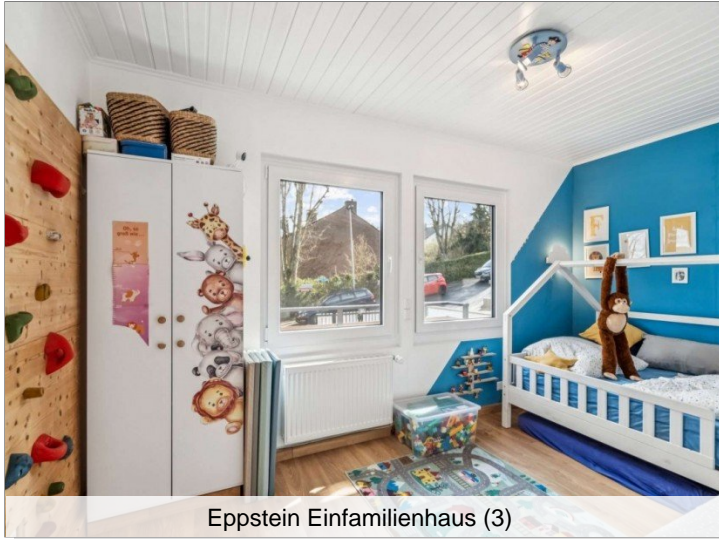
Eppstein Einfamilienhaus (3)