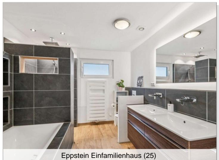
Eppstein Einfamilienhaus (25)