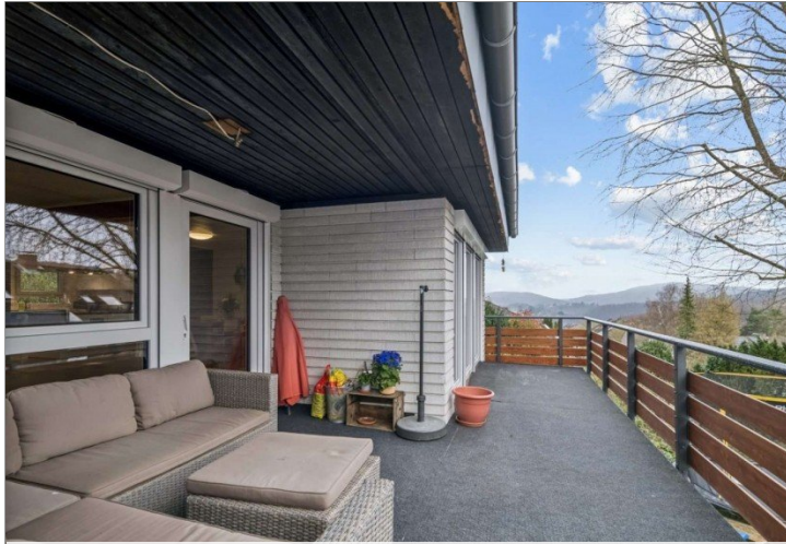
Eppstein Einfamilienhaus (24)