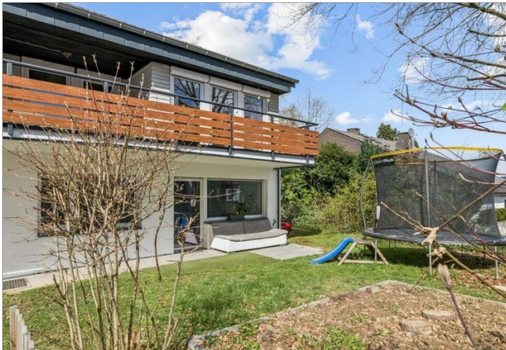
Eppstein Einfamilienhaus (9)