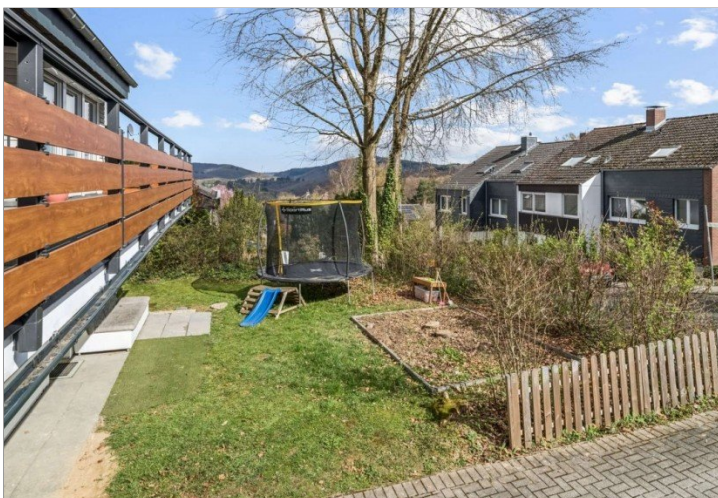
Eppstein Einfamilienhaus (11)