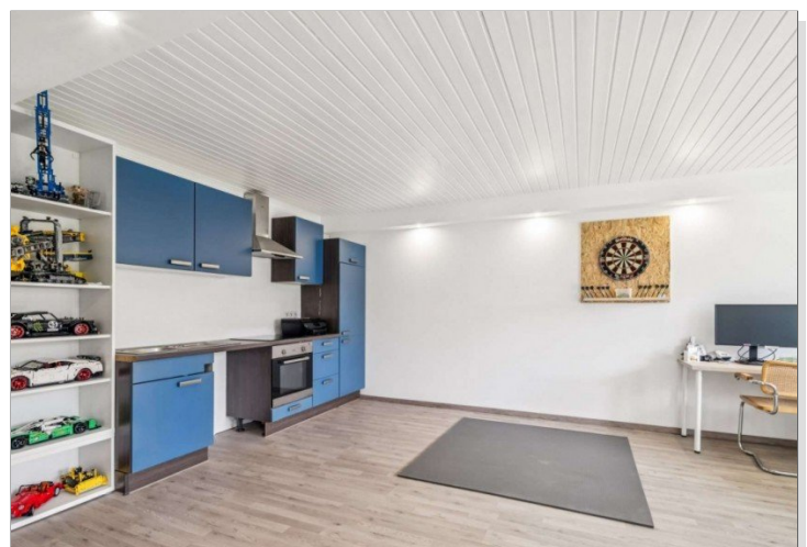
Eppstein Einfamilienhaus (6)