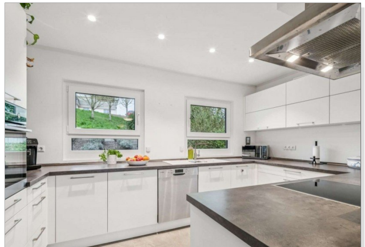
Eppstein Einfamilienhaus (18)