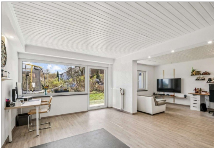
Eppstein Einfamilienhaus (4)