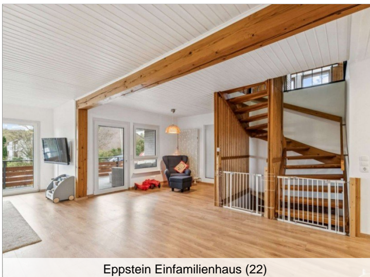
Eppstein Einfamilienhaus (22)