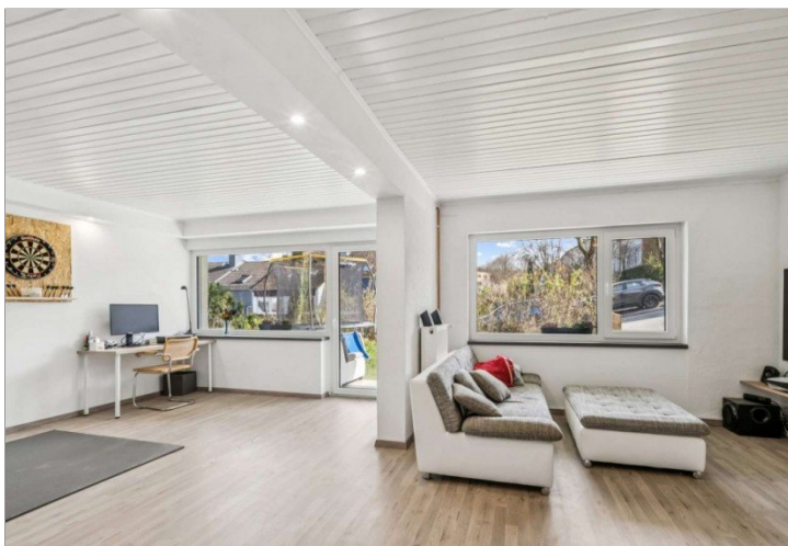
Eppstein Einfamilienhaus (5)