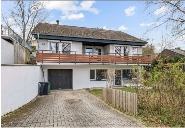
Eppstein Einfamilienhaus (8)