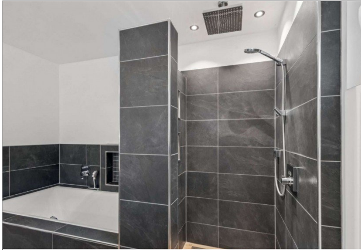
Eppstein Einfamilienhaus (1)