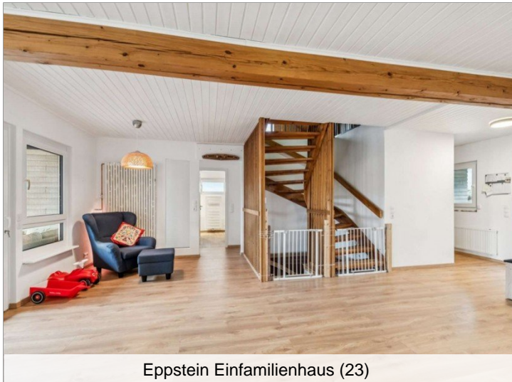
Eppstein Einfamilienhaus (23)