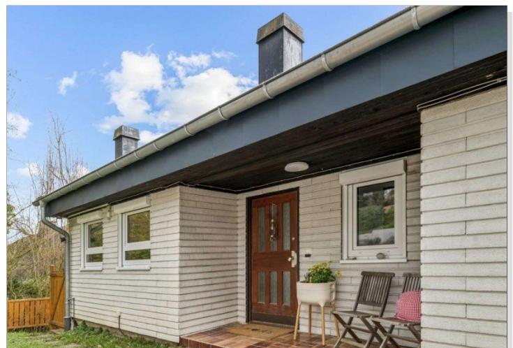
Eppstein Einfamilienhaus (13)