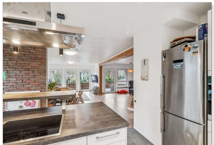
Eppstein Einfamilienhaus (19)