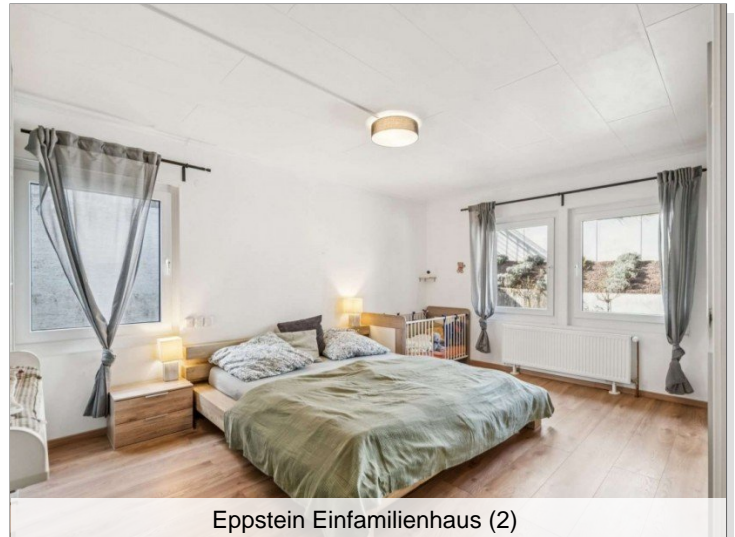
Eppstein Einfamilienhaus (2)