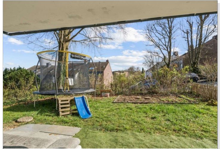
Eppstein Einfamilienhaus (7)