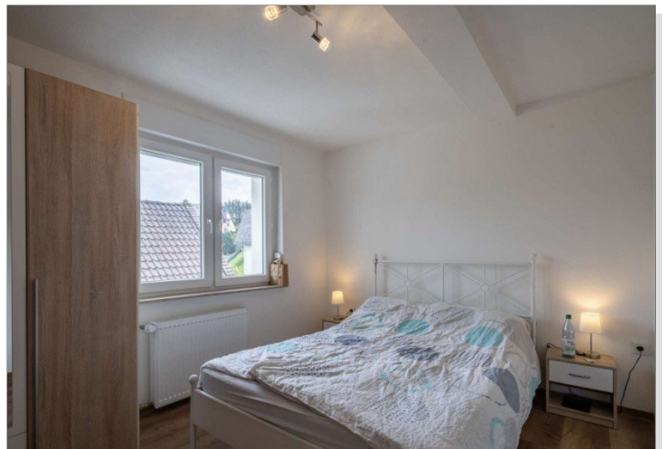
Heidenrod Einfamilienhaus 7