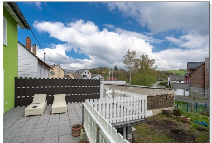
Heidenrod Einfamilienhaus 18