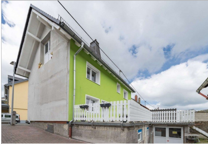
Heidenrod Einfamilienhaus 13