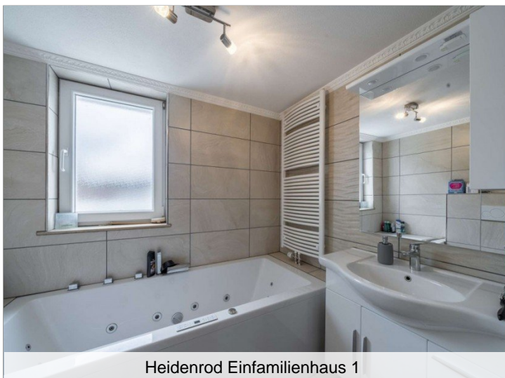
Heidenrod Einfamilienhaus 1