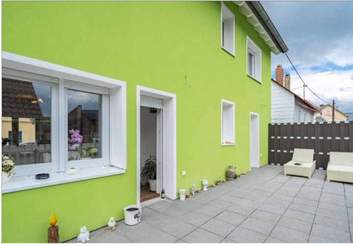
Heidenrod Einfamilienhaus 4