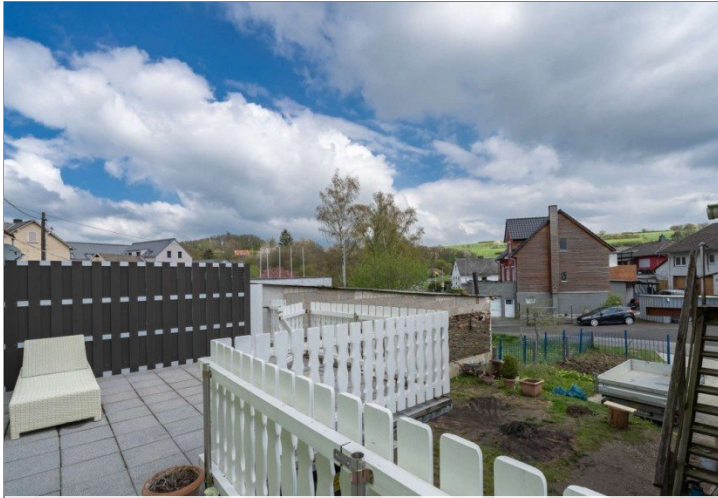
Heidenrod Einfamilienhaus 17