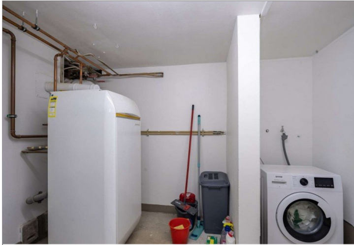
Heidenrod Einfamilienhaus 23