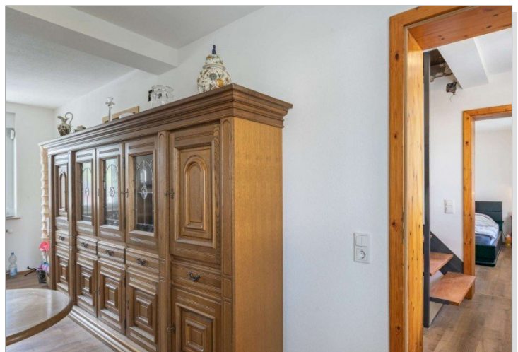
Heidenrod Einfamilienhaus 10