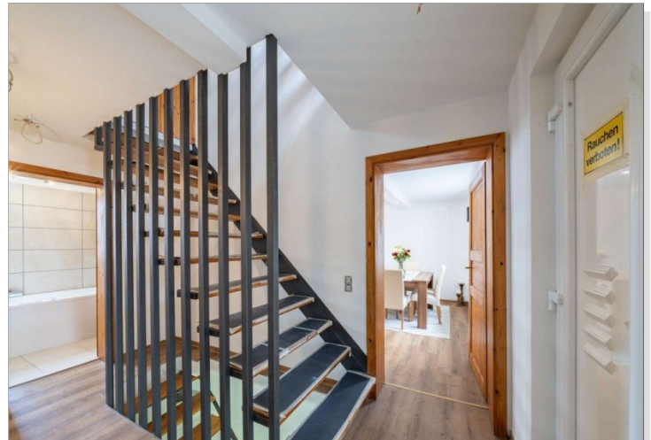
Heidenrod Einfamilienhaus 2