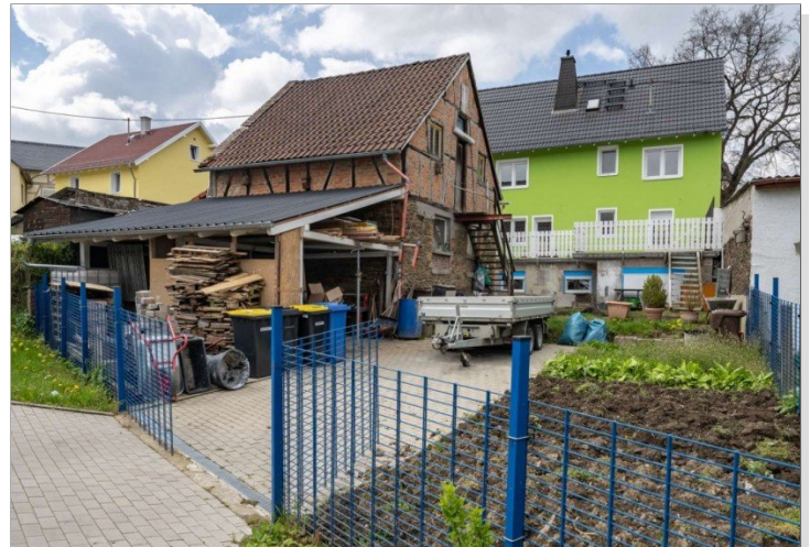
Heidenrod Einfamilienhaus 15