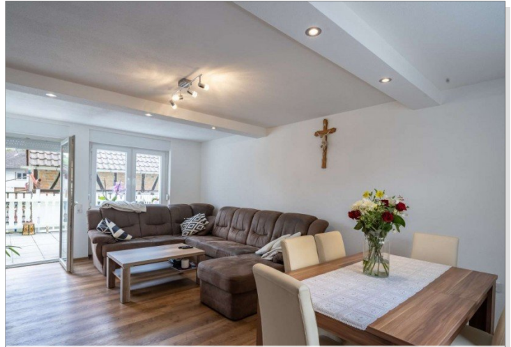
Heidenrod Einfamilienhaus 3