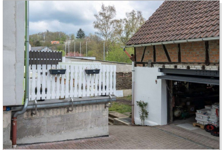
Heidenrod Einfamilienhaus 14