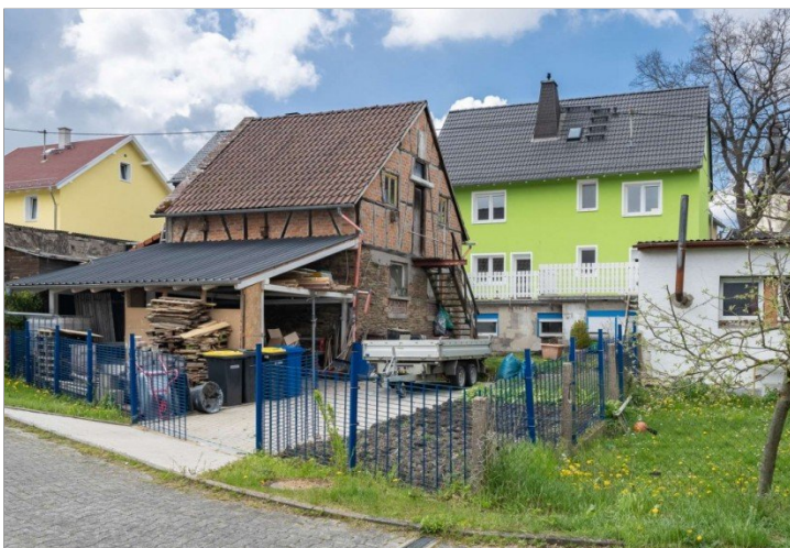
Heidenrod Einfamilienhaus 16