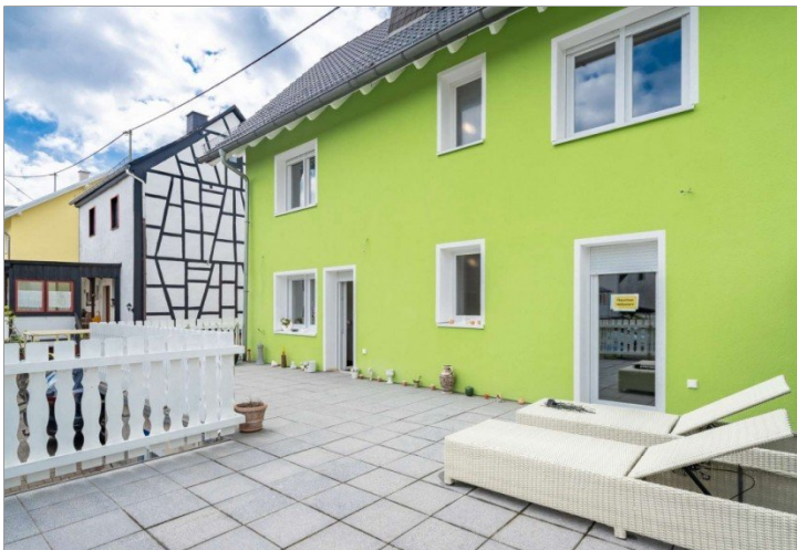
Heidenrod Einfamilienhaus 5