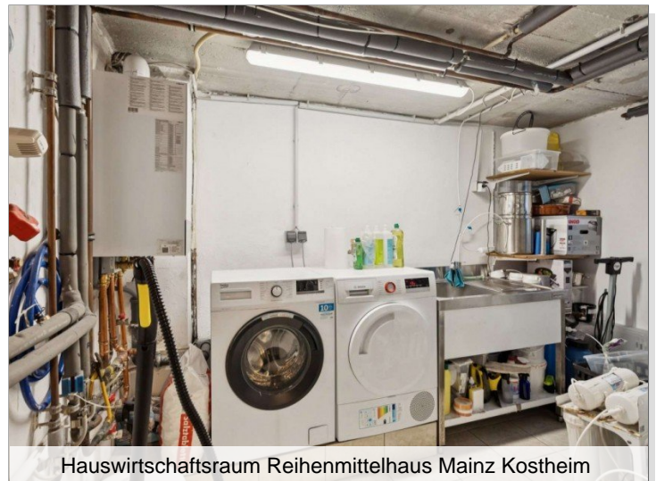
Hauswirtschaftsraum Reihenmittelhaus Mainz Kostheim