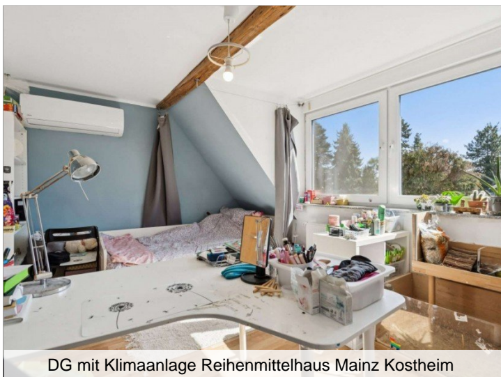
DG mit Klimaanlage Reihenmittelhaus Mainz Kostheim