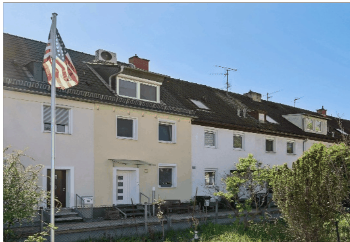
Außenansicht Reihenmittelhaus Mainz - Kostheim