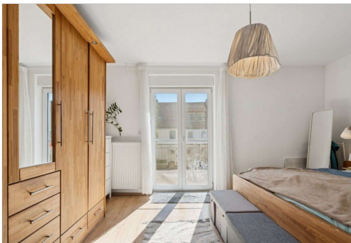
Reihemittelhaus Mainz Kostheim