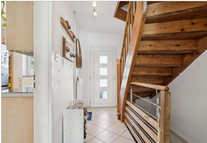
Flur Reihemittelhaus Mainz Kostheim