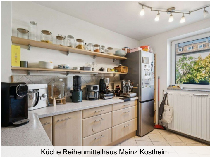
Küche Reihenmittelhaus Mainz Kostheim