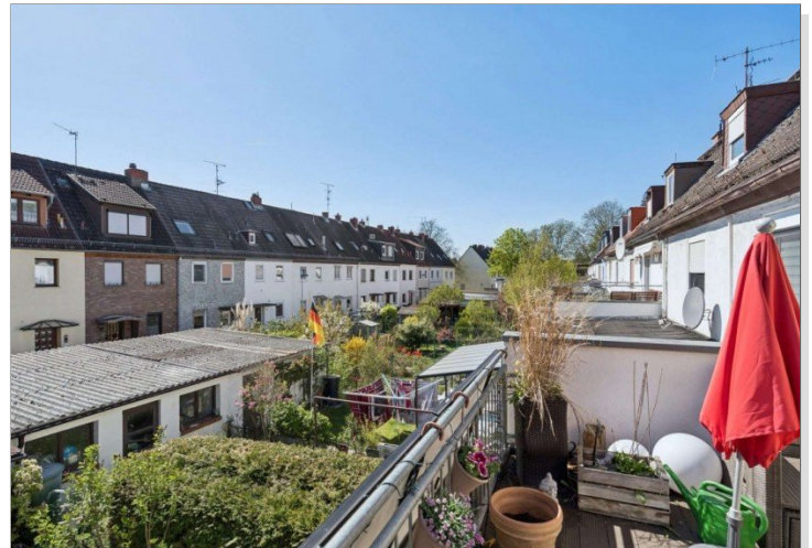
Aussicht Reihemittelhaus Mainz Kostheim