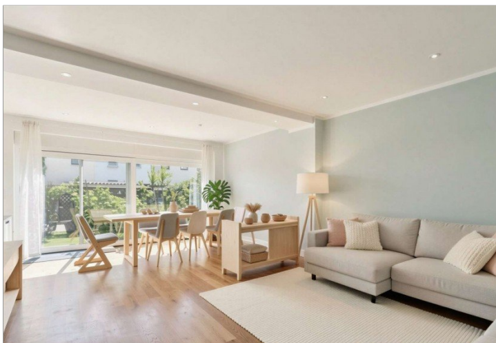
Homestaging Wohnzimmer - (KI generiert)