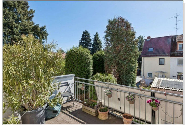
Terrasse Reihemittelhaus Mainz Kostheim