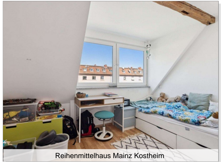
Reihenmittelhaus Mainz Kostheim