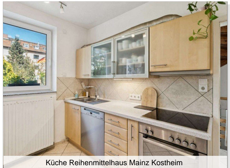
Küche Reihenmittelhaus Mainz Kostheim