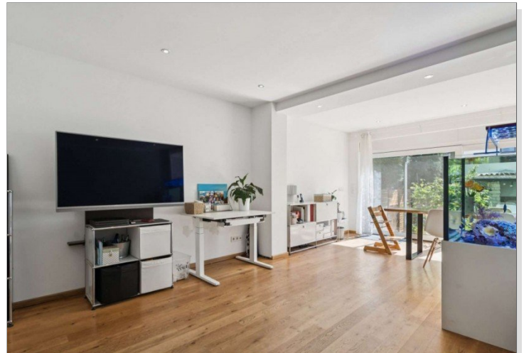
Reihenmittelhaus Mainz Kostheim