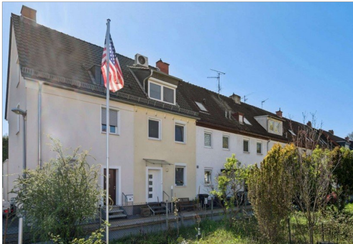
Reihenmittelhaus Mainz Kostheim