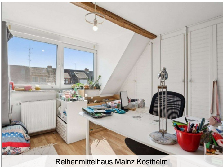
Reihenmittelhaus Mainz Kostheim