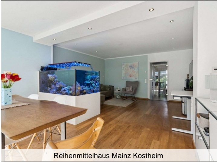
Reihenmittelhaus Mainz Kostheim