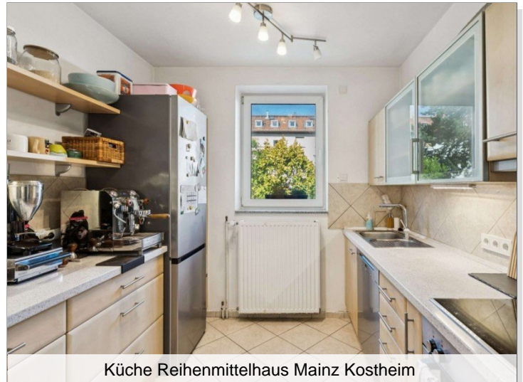
Küche Reihenmittelhaus Mainz Kostheim