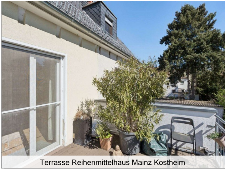
Terrasse Reihenmittelhaus Mainz Kostheim