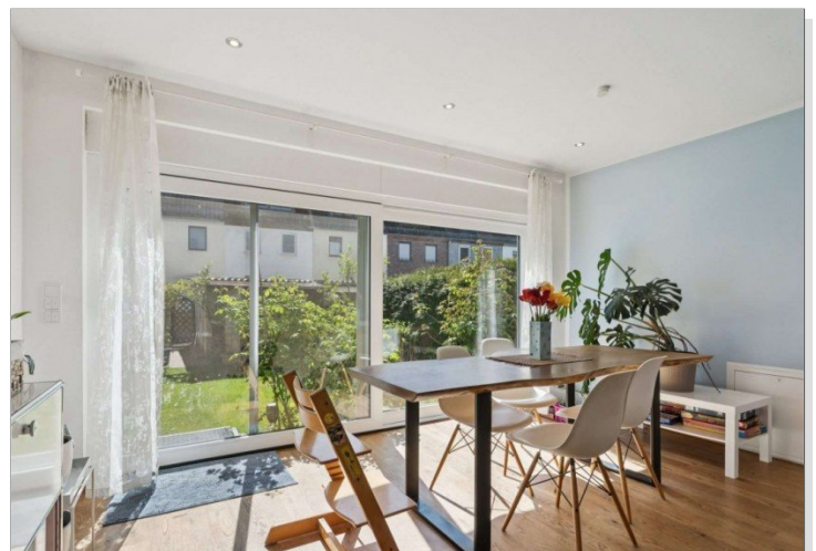
Reihenmittelhaus Mainz Kostheim