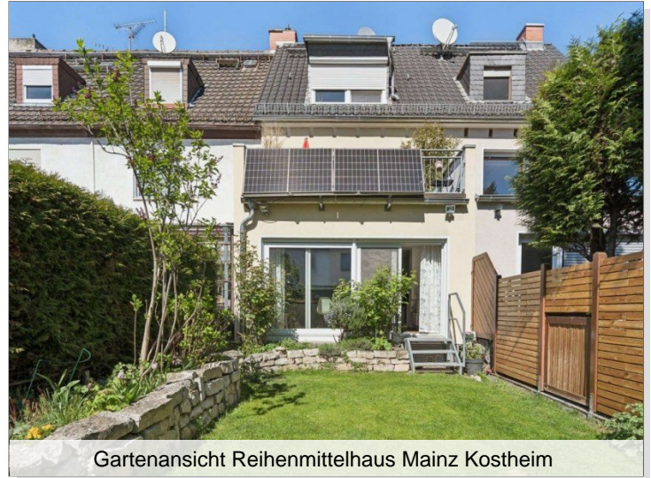
Gartenansicht Reihenmittelhaus Mainz Kostheim