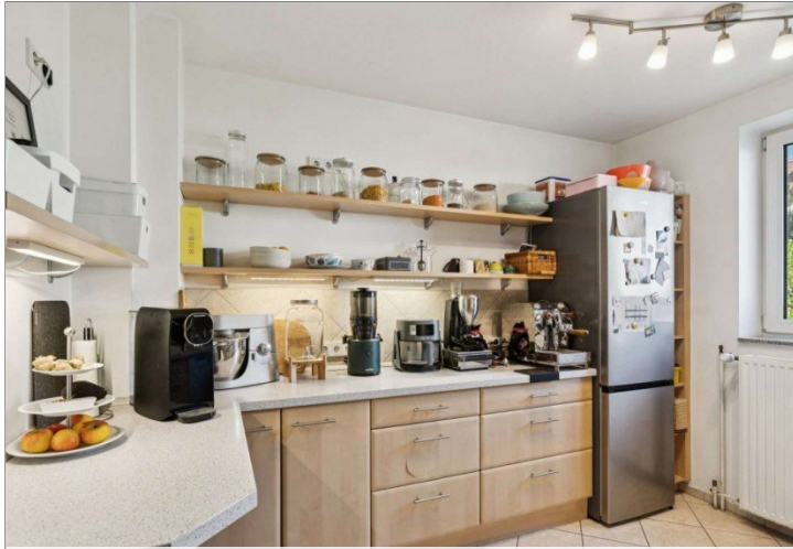
Küche Reihemittelhaus Mainz Kostheim