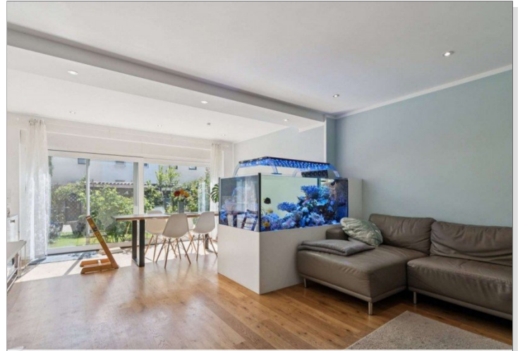
Wohnzimmer Reihenmittelhaus Mainz Kostheim