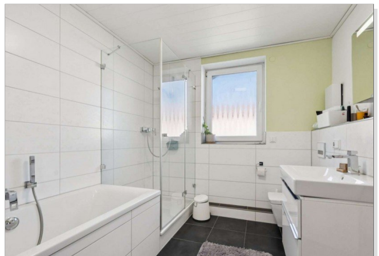
Badezimmer Reihemittelhaus Mainz Kostheim