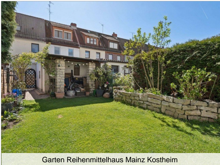
Garten Reihenmittelhaus Mainz Kostheim