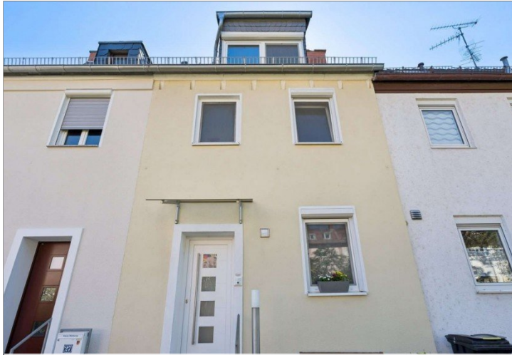
Reihenmittelhaus Mainz Kostheim