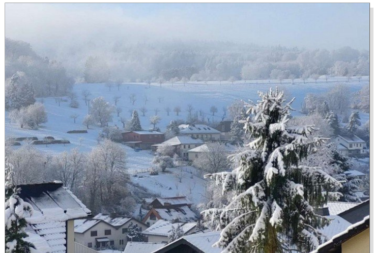
Ausblick im Winter