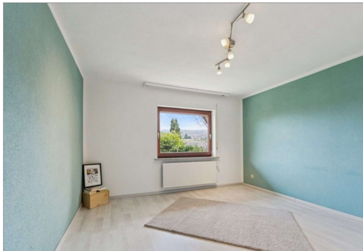
Beispielzimmer Niedernhausen-Engenhahn-22 (22)