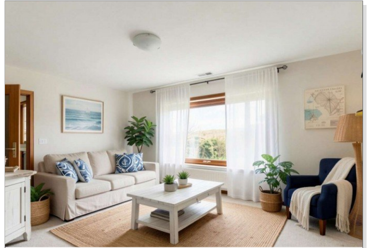
Homestaging Beispielraum- (KI generiert)