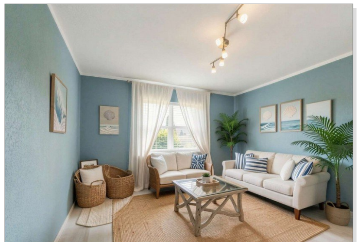
Homestaging Beispielzimmer Niedernhausen-Engenhahn-22 (22) - (KI generiert)