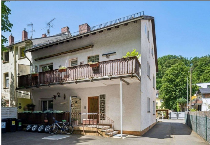
Wiesbaden Rambach Mehrfamilienhaus (1)