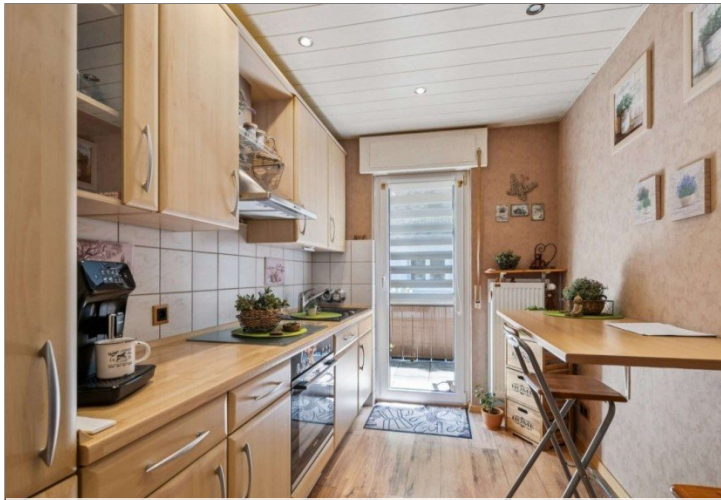
Wiesbaden Rambach Mehrfamilienhaus (12)