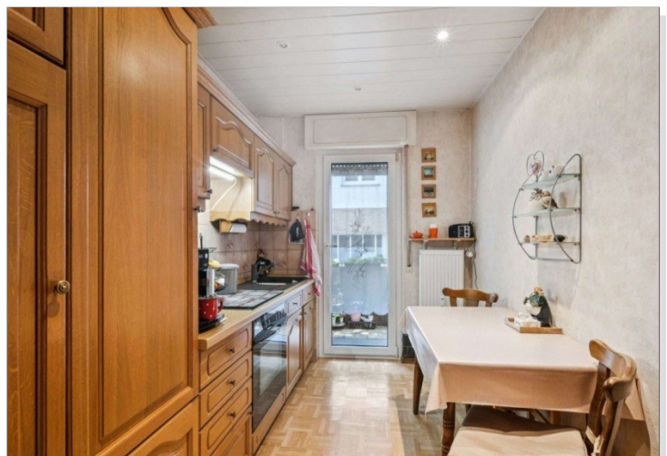
Wiesbaden Rambach Mehrfamilienhaus (20)