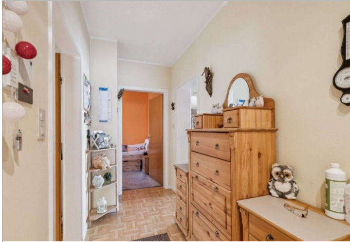
Wiesbaden Rambach Mehrfamilienhaus (19)