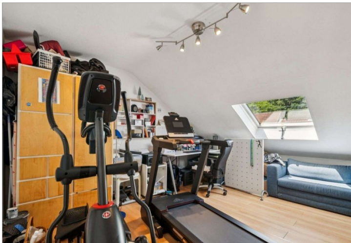
Wiesbaden Rambach Mehrfamilienhaus (6)