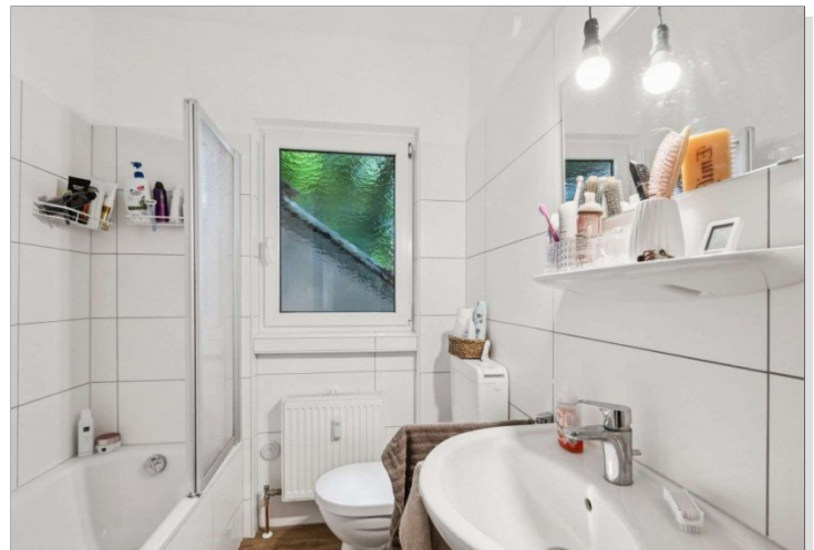
Wiesbaden Rambach Hinterhaus 1. OG