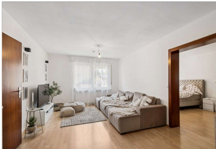
Wiesbaden Rambach Hinterhaus 1. OG