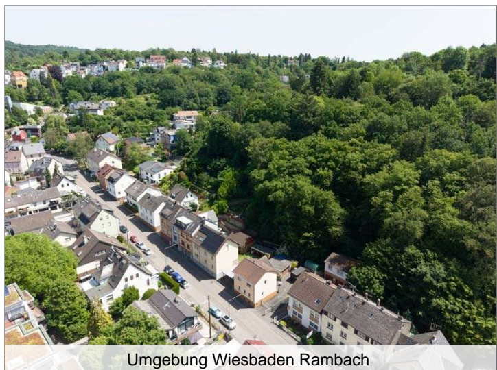
Umgebung Wiesbaden Rambach