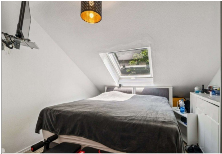
Wiesbaden Rambach Mehrfamilienhaus (5)