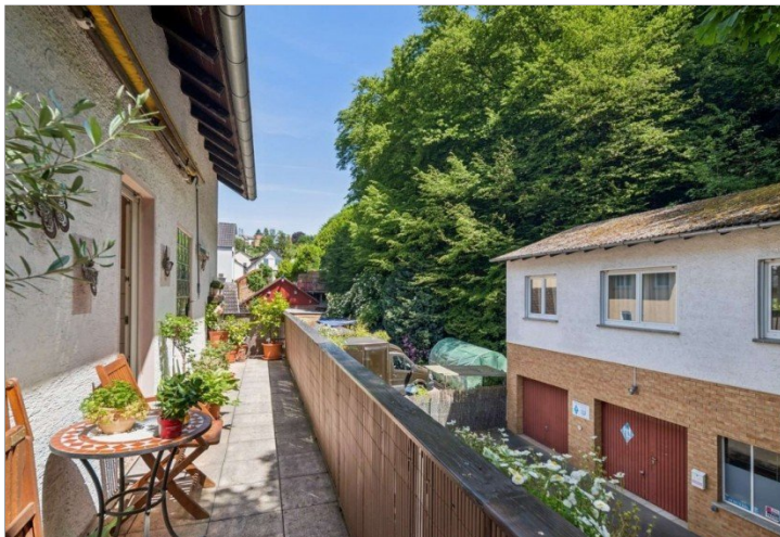
Wiesbaden Rambach Mehrfamilienhaus (13)