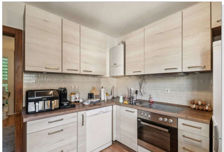
Wiesbaden Rambach Mehrfamilienhaus (15)