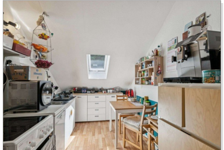
Wiesbaden Rambach Mehrfamilienhaus (4)