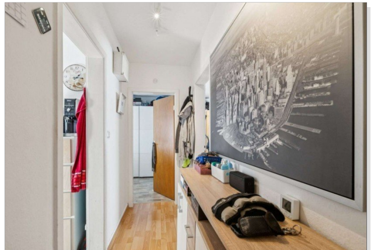
Wiesbaden Rambach Mehrfamilienhaus (3)