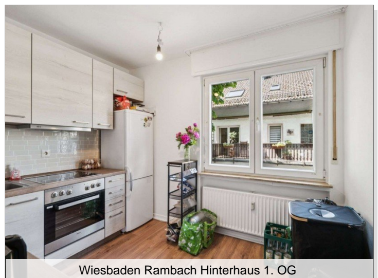
Wiesbaden Rambach Hinterhaus 1. OG