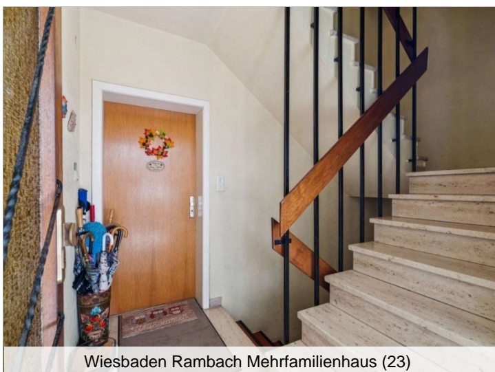
Wiesbaden Rambach Mehrfamilienhaus (23)