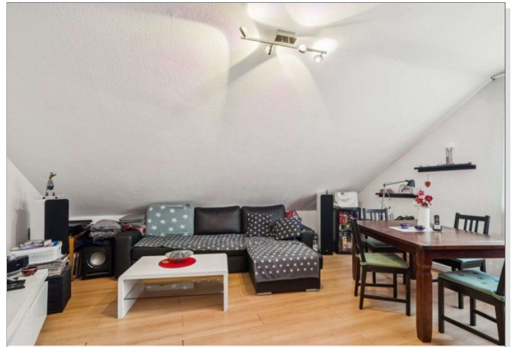
Wiesbaden Rambach Mehrfamilienhaus (7)