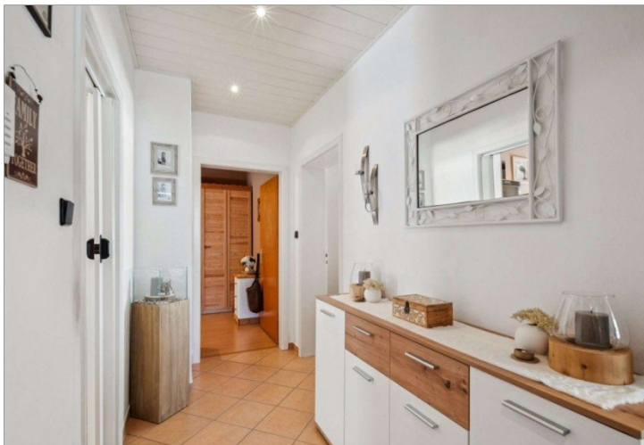
Wiesbaden Rambach Mehrfamilienhaus (11)