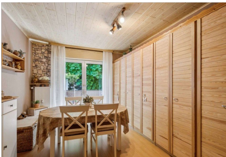
Wiesbaden Rambach Mehrfamilienhaus (14)