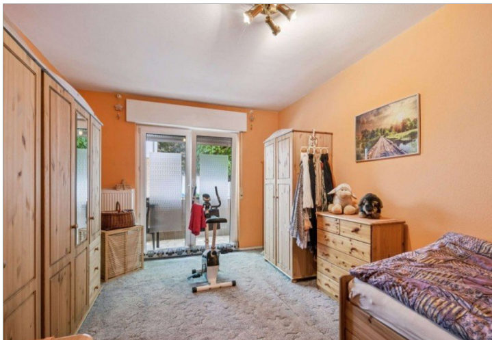
Wiesbaden Rambach Mehrfamilienhaus (21)