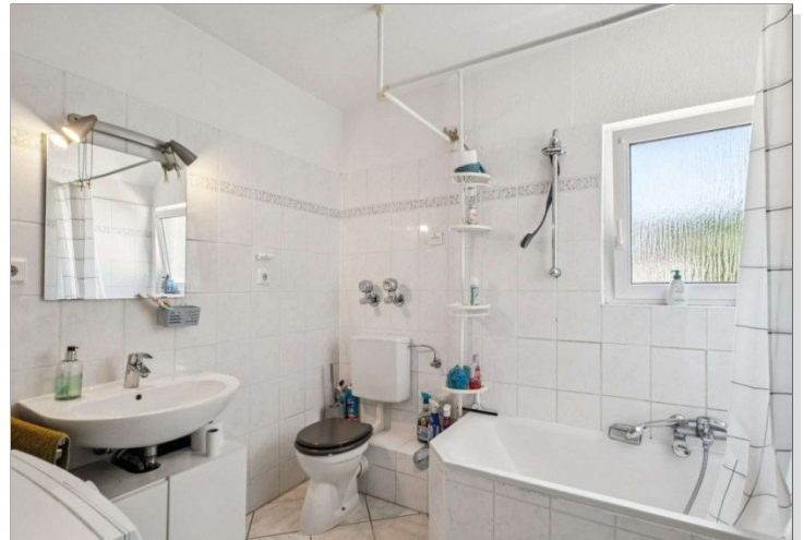
Wiesbaden Rambach Mehrfamilienhaus (2)