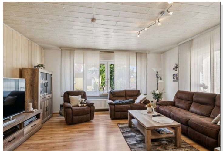
Wiesbaden Rambach Mehrfamilienhaus (10)