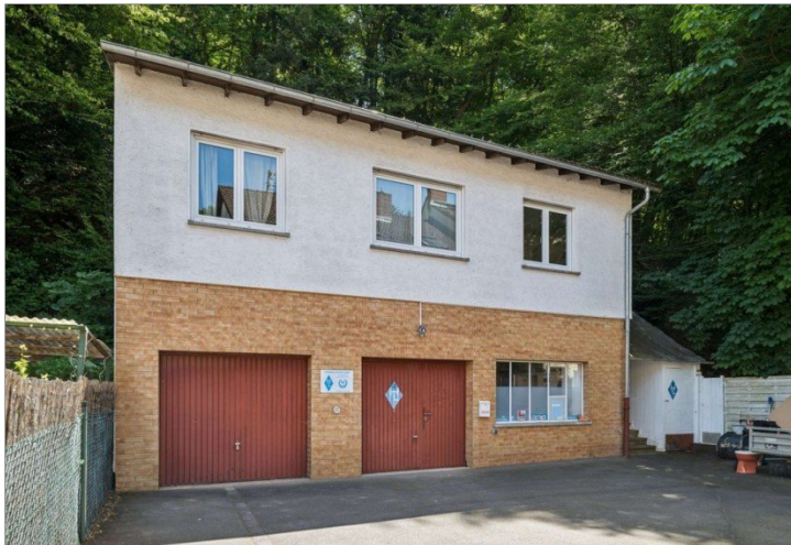
Wiesbaden Rambach Mehrfamilienhaus (26)