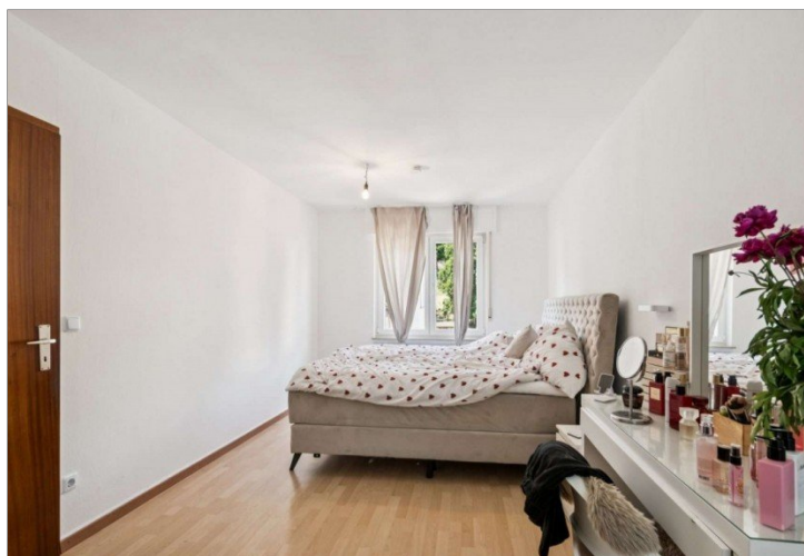
Wiesbaden Rambach Hinterhaus 1. OG