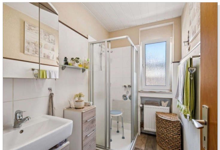
Wiesbaden Rambach Mehrfamilienhaus (9)