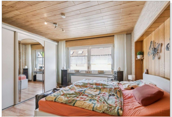
Wiesbaden Rambach Mehrfamilienhaus (16)