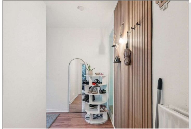
Wiesbaden Rambach Mehrfamilienhaus (24)