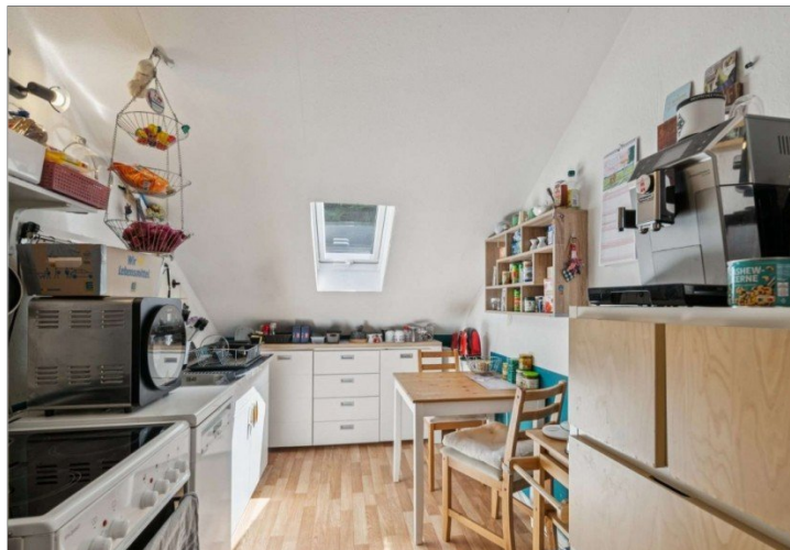
Wiesbaden Rambach Mehrfamilienhaus (4)